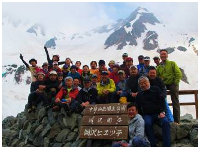
過去のイベントの写真です